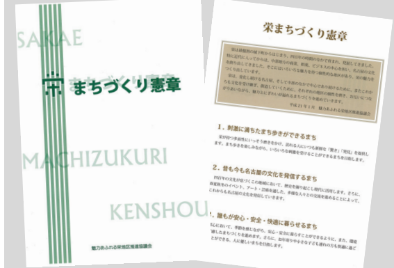
▲今年度作成した憲章パンフレット