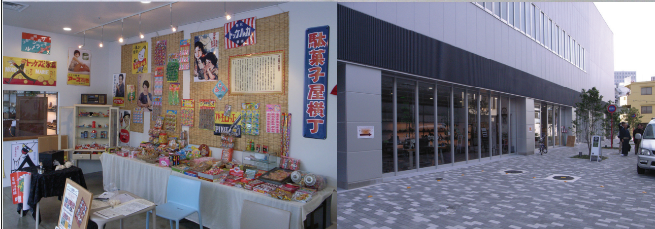
●地場で生産する駄菓子を紹介する「駄菓子屋横丁」の展示風景。さまざまなイベント等で活用しています。