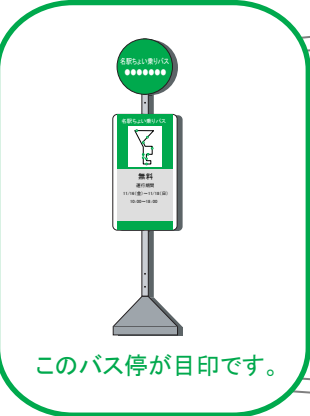
このバス停が目印です。